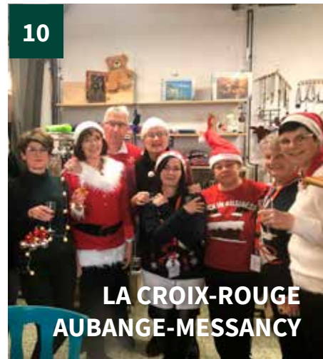
LA CROIX-ROUGE AUBANGE-MESSANCY