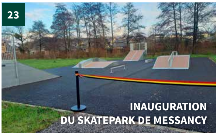
INAUGURATION DU SKATEPARK DE MESSANCY