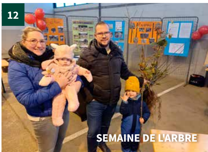
SEMAINE DE L'ARBRE