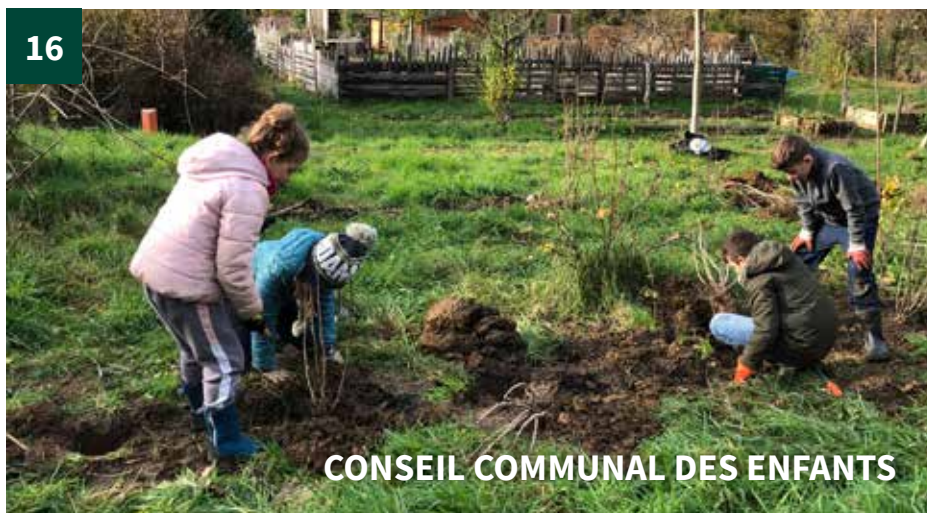
CONSEIL COMMUNAL DES ENFANTS