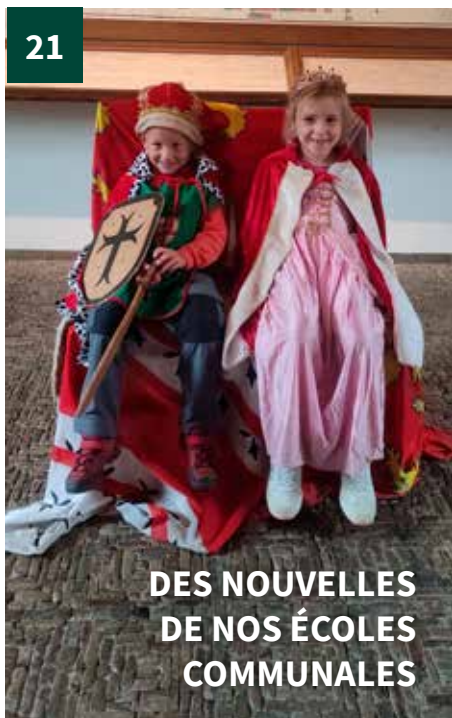
DES NOUVELLES DE NOS ÉCOLES COMMUNALES